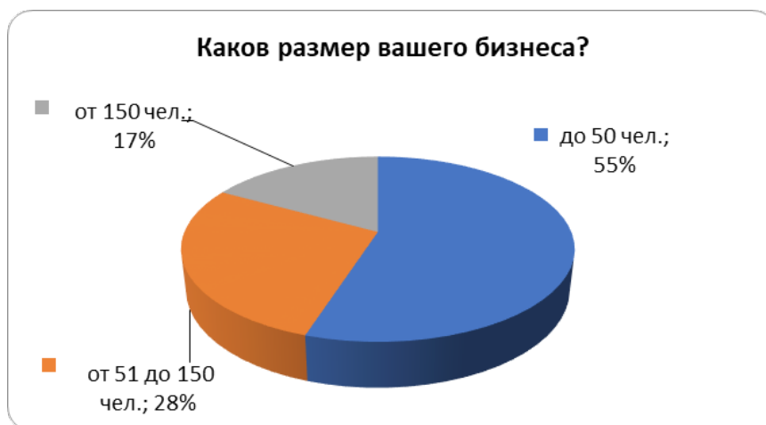
Рисунок 1 - Ответы на вопрос 6: Каков размер вашего бизнеса

С целью установления размера туристических предприятий и количества персонала анкетированным был задан следующий вопрос: