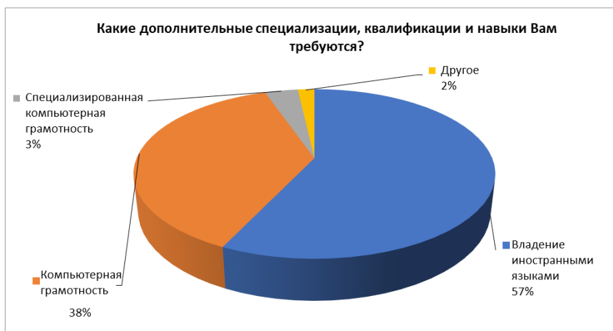
Рисунок 4 - Ответы на вопрос 9: Какие дополнительные специализации, квалификации и навыки Вам требуются

57% работодателей указали важность владения иностранным языком, так как Болгария принимает большое количество иностранных туристов. 38% анкетированных работодателей указывают на требование дополнительной квалификации и компьютерной грамотности. Использование специального программного обеспечения гостиничными и ресторанными комплексами, также предпочтенная дополнительная квалификация, на которую указывают 3% работодателей.