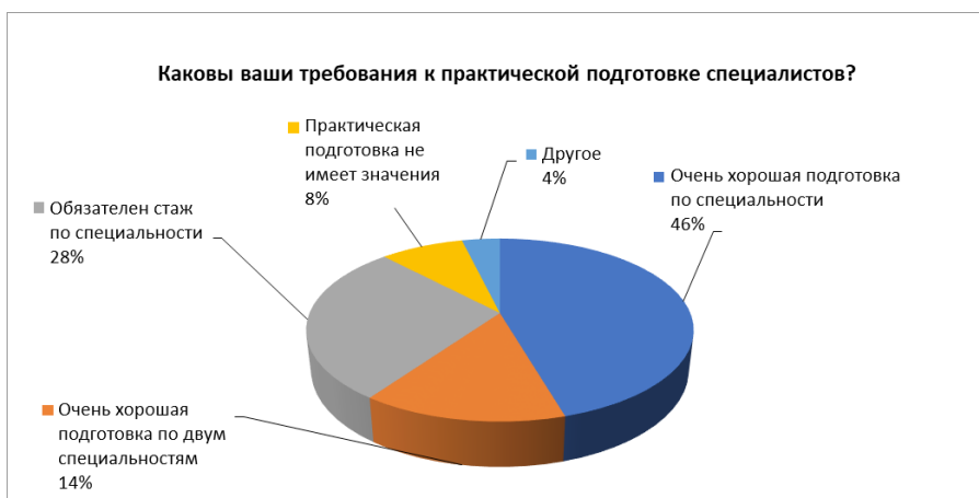
Рисунок 3 - Ответы на вопрос 8: Ваши требования к практической подготовке специалистов

По отношению к практической подготовке специалистов, окончивших профессиональное направление 3.9 «Туризм», результаты следующие: